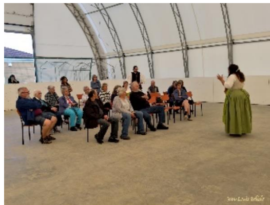
Soirée acadienne de Port-Royal. L'histoire de la déportation des acadiens vers St-Grégoire.