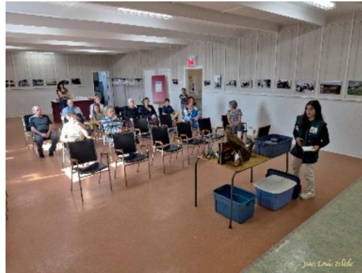
Musée de la biodiversité