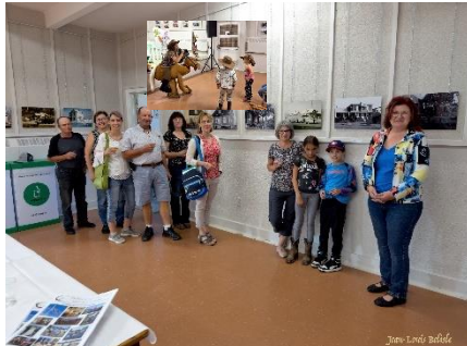
Vernissage de photos anciennes